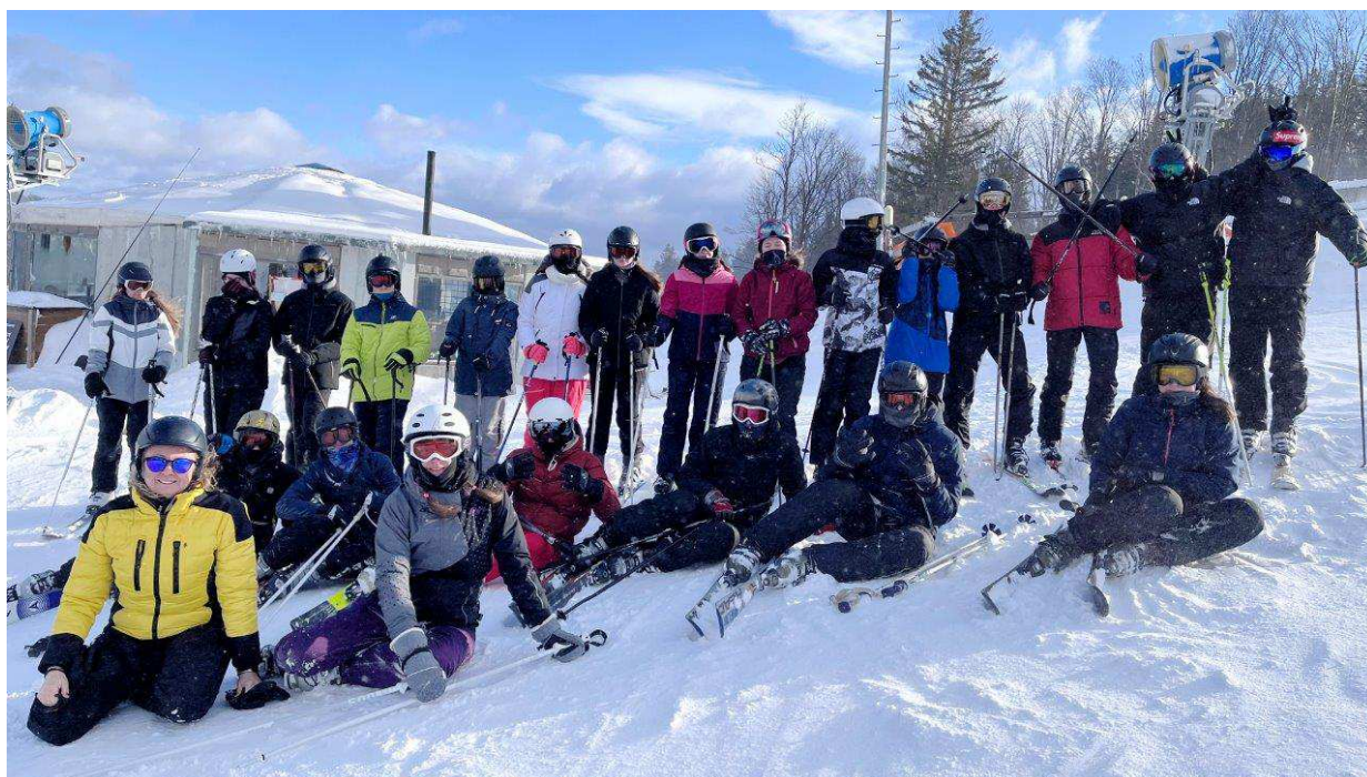
Výcvik na sjezdovce, ubytování

Kurzů se zúčastnilo celkem 74 žáků pod vedením pěti pedagogů – instruktorů a zdravotníka.