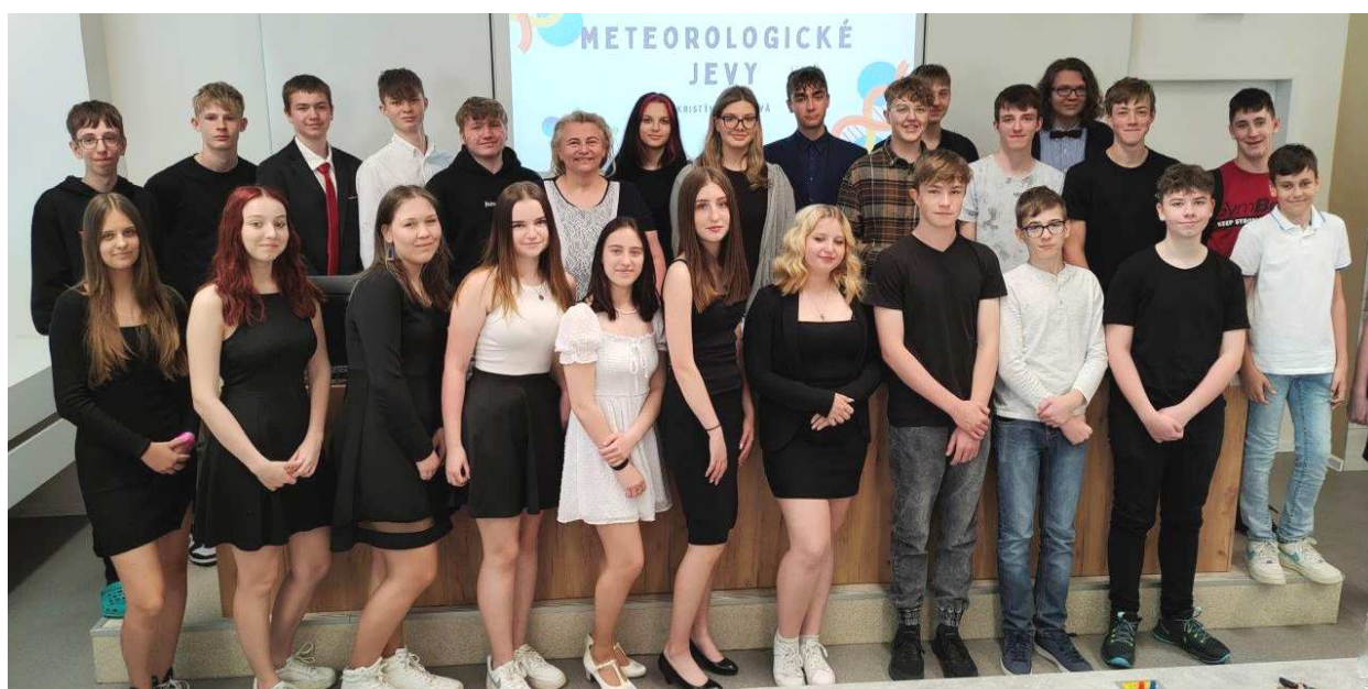
Obhajoba absolventských prací