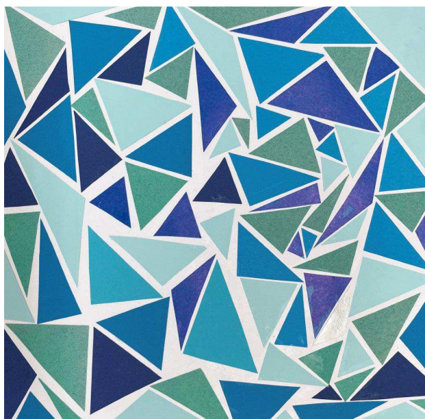
„Mozaika“ - Eliška Heresová (9. B)